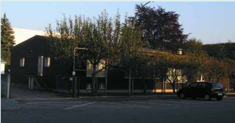
Das Firmengebäude in Friedberg